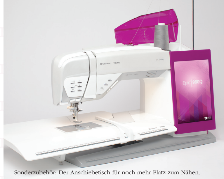
Sonderzubehör: Der Anstiebtisch für noch mehr Platz zum Nähen.