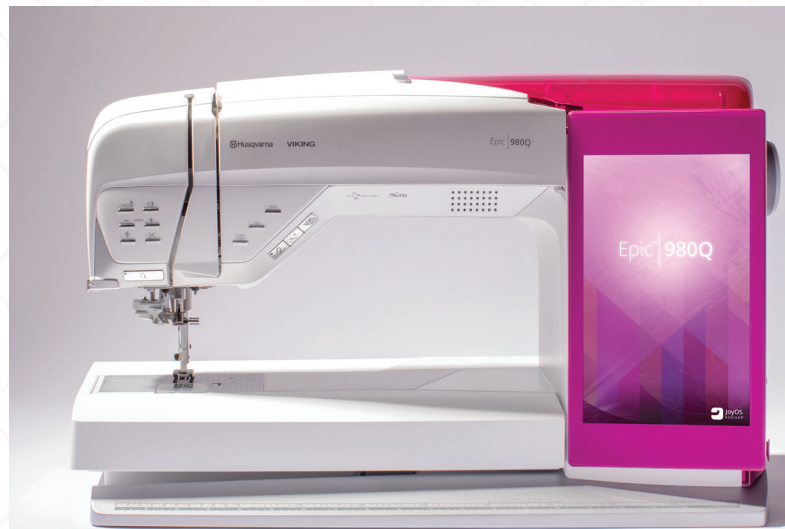
Entwickelt und konstruiert in Schweden - MADE FOR Sewer, by Sewer™.