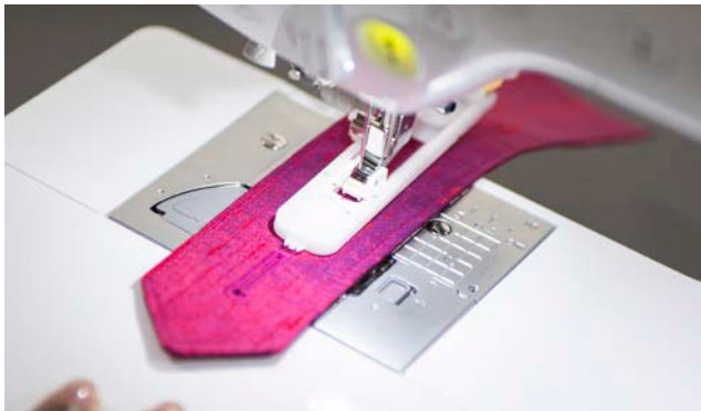
1-Stufen-Knopflochautomatik in 10 Varianten