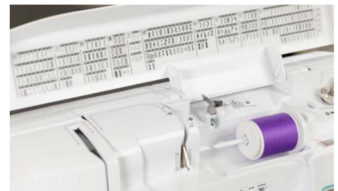
241 integrierte Näh- und Dekorstiche