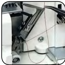
Untergreifer mit der Click-to-go-Technik