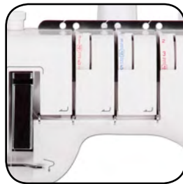
Farbcodierte innenliegende Fadeneinführung