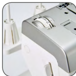
Einstellrad zur Fußdruckanpassung