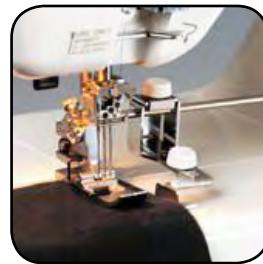
Extra großer Stoffdurchlass